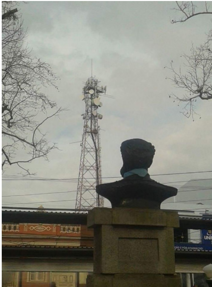
Figura 1: Ítalo Costa . Almirante Tamandaré olhando para a torre telefônica , fotografia, 2015.

Almirante Tamandaré[1], está de frente para uma parada de ônibus (Figura 1) e ninguém o vê a não ser que passe atrás dele. Isso me causou uma sensação de estranhamento, e procurando um modo de refletir sobre este fenômeno, decidi registrar o que aquelas esculturas estão fadadas a ver.