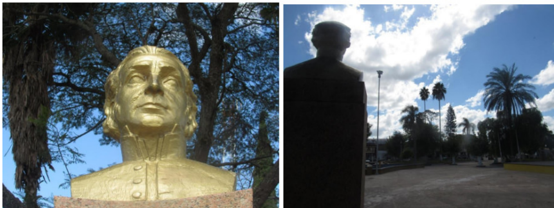
Figura 4: Ítalo Costa . Estátua do General Artigas olhando para a praça vazia, Rio Branco – Uruguai, Fotografia, 2016.

Representando a harmonia entre os dois países na “Fronteira da Paz”, as estátuas estão bem cuidadas, com pequenas assinaturas urbanas que apenas os tornam mais pertencentes a cidade. Cumprem seu papel, sendo vistas e apreciadas por seus visitantes, exaltando a nacionalidade entre os territórios vizinhos.