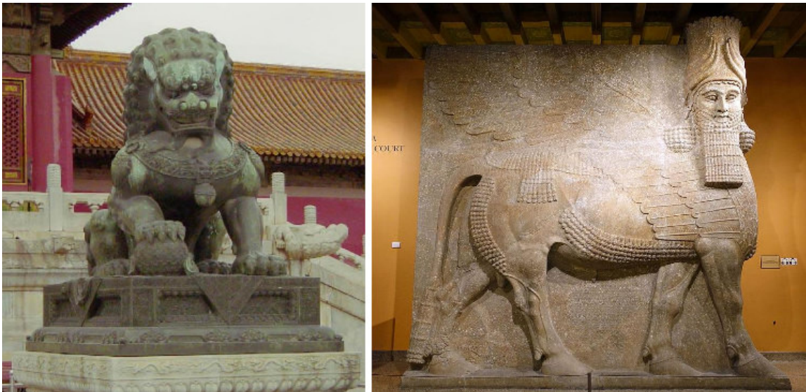
Figura 2: Komainu e Lamassu (respectivamente), escultura, Cidade Proibida e Instituto Oriental da Universidade de Chicago. Disponível em:

Outras culturas do oriente também partiram da mesma prerrogativa, e criaram esculturas para serem verdadeiras sentinelas, geralmente vigiando a entrada de templos, como é o caso dos Komainu , no Japão e China, ou dos Lamassu (Figura 2), na Mesopotâmia.