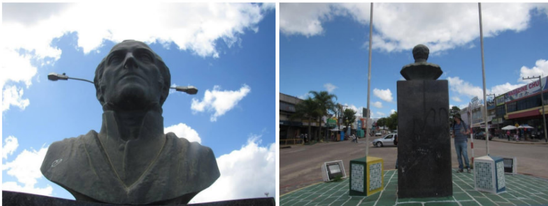
Figura 3: Ítalo Costa . Estátua do General Artigas olhando para a avenida e para seu companheiro de eternidade, o Barão de Rio Branco, Fotografia, 2016.

De todos os bustos nas cidades visitadas, talvez o de Artigas do Chuí/Chuy (Figura3) deva ser o mais "afortunado". Um dos motivos é sua localização, na principal avenida da cidade, caracterizada como uma linha imaginária de fronteira, pode ver o movimento diurno do comércio nos freeshops , os carrinhos de pancho , e dos visitantes brasileiros e comerciantes uruguaios em uma profusão de formigueiro. E a noite, quando a cidade parece esvaziar, encontra um companheiro no Barão Rio Branco, o busto que fica em sua frente. Sem se preocupar com a escassez de pessoas, pois uma vez que o mercado continue funcionando, sempre haverá alguém para ser testemunhado.