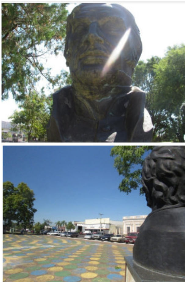
Figura 5: Ítalo Costa . Estátua do General Artigas olhando para a o espaço da praça, Quaraí – Brasil, Fotografia, 2016.

O General Artigas da cidade de Quaraí (Figura 5), também distante da fronteira propriamente dita, talvez seja o mais nostálgico de todos os Artigas Fronteiriços. Na praça que habita desde 1999, graças a um esforço das “Lojas Artigas”, ele testemunhou o desenvolvimento de diferentes gerações.